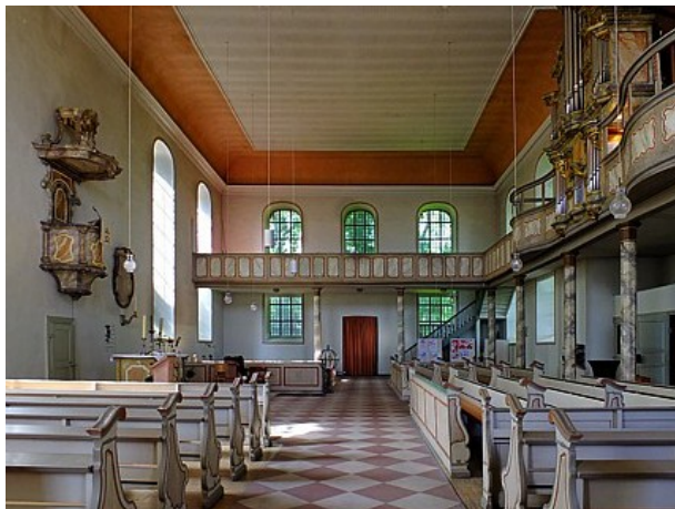
Foto: Innenansicht der Ev. Martinskirche in Jugenheim, erbaut 1762-1775 von F.J. Stengel.

Auch 2026 werden wir einen Gemeindeausflug anbieten, in diesem Jahr gemeinsam mit dem Förderverein „Freunde der Ludwigskirche e.V.“. Aller Voraussicht nach fahren wir am 12. September zur großen Stengel-Kirche nach Jugenheim in Rheinhessen. Nähere Informationen erhalten Sie im Sommer.